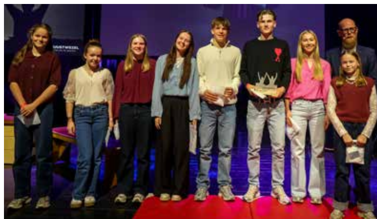
© wezelopdefoto; bekijk de hele fotoreportage met prachtige beelden op www.wezelopdefoto.be .

Het lokaal bestuur en de sportraad danken ook de vele partners en vrijwilligers die het Sportgala mogelijk maakten, waaronder Berkenbeek voor de hapjes tijdens de receptie, Wezelopdefoto voor de fotografie van de avond, Snow and Event Service voor de technische ondersteuning, Kolibrerie Creaties voor de trofeeën en Wuustwezel Cycling voor de sportsokken die werden uitgedeeld als aandenken.