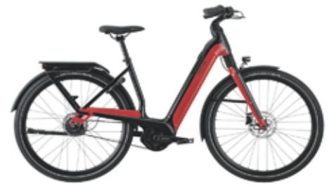
Cannondale Mavaro Neo 4 van €4499 voor €3999

Bosch Performance Line 65 Nm middenmotor 625Wh accu +100 km actieradius Onderhoudsarm door riemaandrijving Dagrijverlichting Subliem rijcomfort door een stabiel frame en brede banden