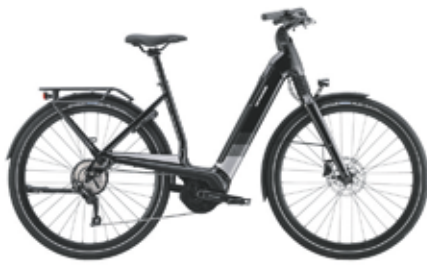
Cannondale Mavaro Neo 5 van €3799 voor €3299

Bosch Active Line+ 50 Nm middenmotor 625Wh accu +100 km actieradius Dagrijverlichting Subliem rijcomfort door een stabiel frame en brede banden