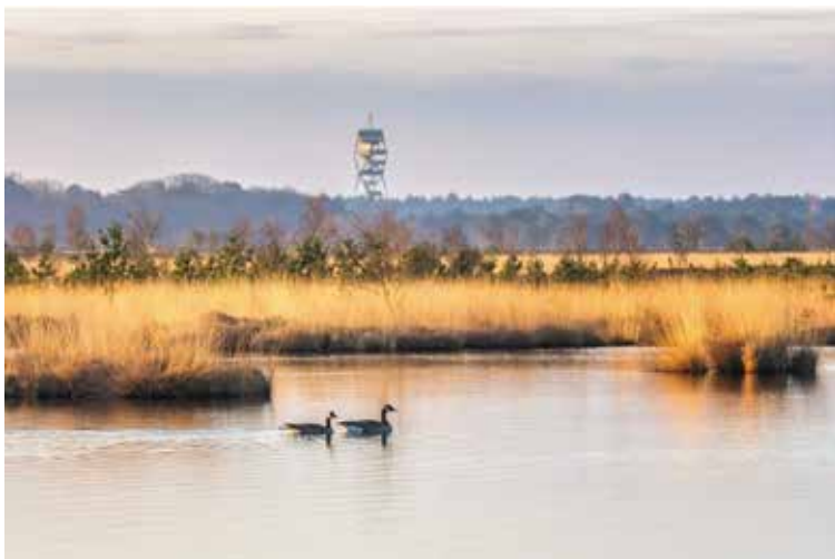
Kalmthoutse Heide