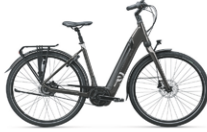
Koga E-Nova Evo PT van €3999 voor €2999

Bosch Active Line+ 50 Nm middenmotor Accukeuze van 400Wh tot 625Wh Onderhoudsarm door riemaandrijving Chique afwerking Fiets met comfortabele zithouding