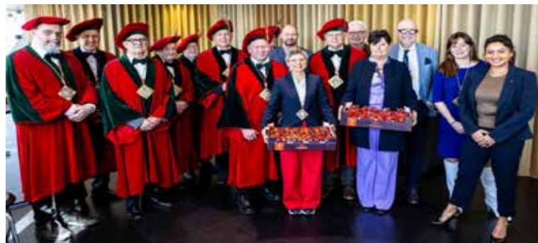
De Ghesellen van de Aardbei van Hoogstraten overhandigen de aardbeien in traditionele klederdracht