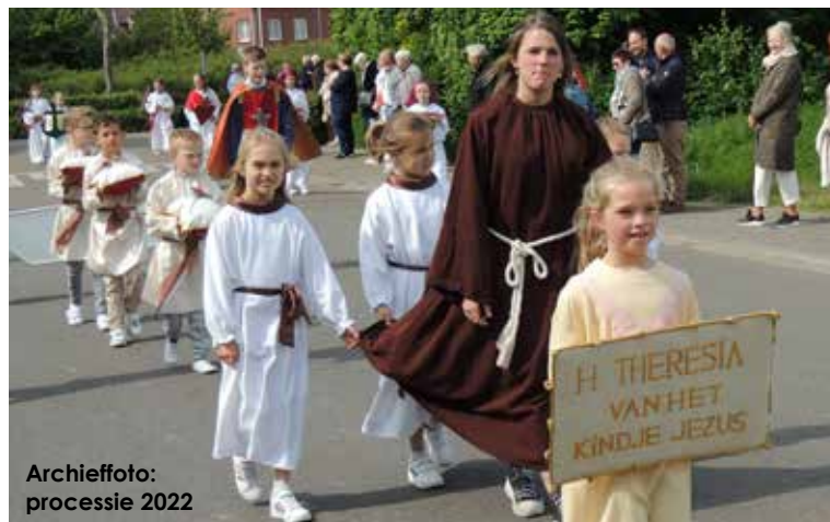
Archiefoto: processie 2022

Om de processie veilig door te laten gaan, is men ook op zoek naar twee tot drie gemachtigde signaalgevers. Wilt u een essentiële taak op u nemen om over de veiligheid van de processie te waken, meldt u zich dan alstublieft aan. Ook hier kan dat met een mail naar frans.schaffels@gmail.com of bel naar 0031 637309252.