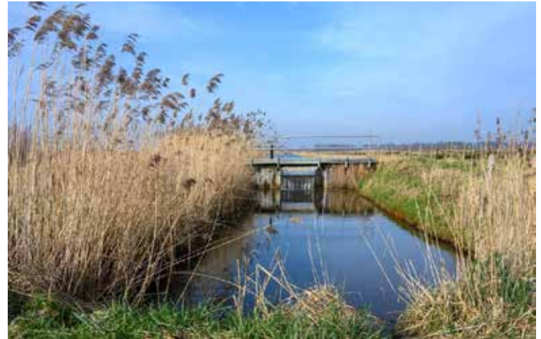
Noordpolder

Wandeling in samenwerking met Natuurpunt Noorderkempen